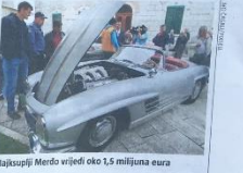
Najstariji Mercedesa izložili su više od 50 oltimera